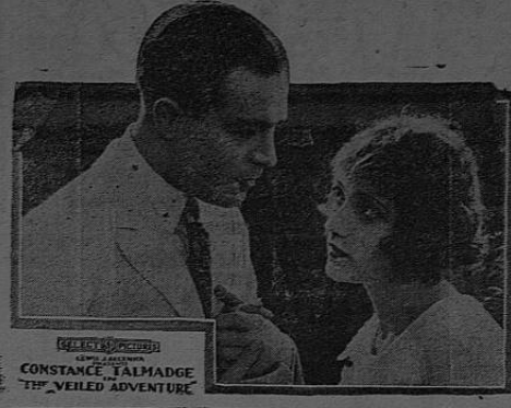
CONSTANCE TALMADGE THE VEILED ADVENTURE